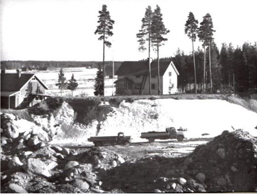
Taavetti ja Selma Pelkosen talo Kokemäen Risteellä Kuva otettu sorakuopan takaa.