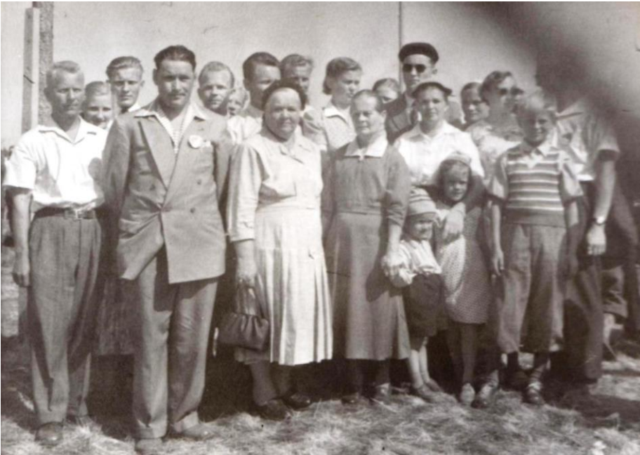
Pelkosten sukua Oulun suviseuroissa 1956