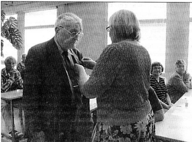
Kuva Räisäläisestä nro 3/ 2009

Esimerkkeinä lehden sisällöstä 11.6.2009 mainittakoon Räisälän kirkon alttaritaulu, kaksi ilmoitusta Pelkosten suvun (ei meidän sukuhaaraa) tapaamisesta, artikkeli räisäläisten nimien juurista (Pelkonen ja muut yleisimmät nimet), kirjoituksia Siirlahden koulusta ja koulupiiristä. Lehden numerossa 10.9.2009 on mm. juttu siirlahtelaisien kokoontumisesta Kokemäellä, jolloin mm. Pentti Pelkoselle luovutettiin kruunullinen Räisälä-rintamerkki.